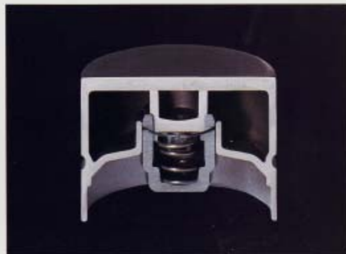
Hydrauliska ventilyftare. De hydrauliska kopparventilyftarna kräver inte något underhåll och ger konsekvent ventilspår.