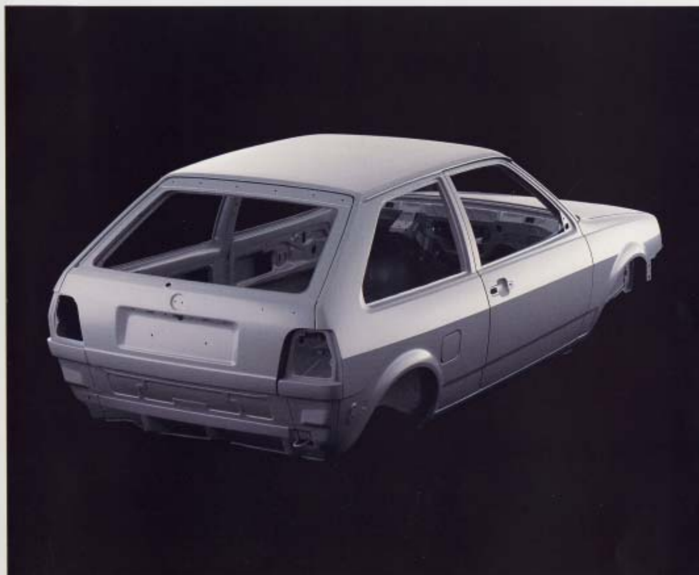
Korrosionsskyddad kaross. De delar av karossen som är särskilt utsatta mot rost, som t.ex. insidan av motorhuven, är silverkade i förzinkad plåt. Alla de nedre håligheterna i karosseriet, dörrarna och bakluckans nedre del behandlas med hetvax som sprutas in i en effektiv helautomatisk process. På så sätt når vaxet även de mest avlägsna skrymskon och vrår.