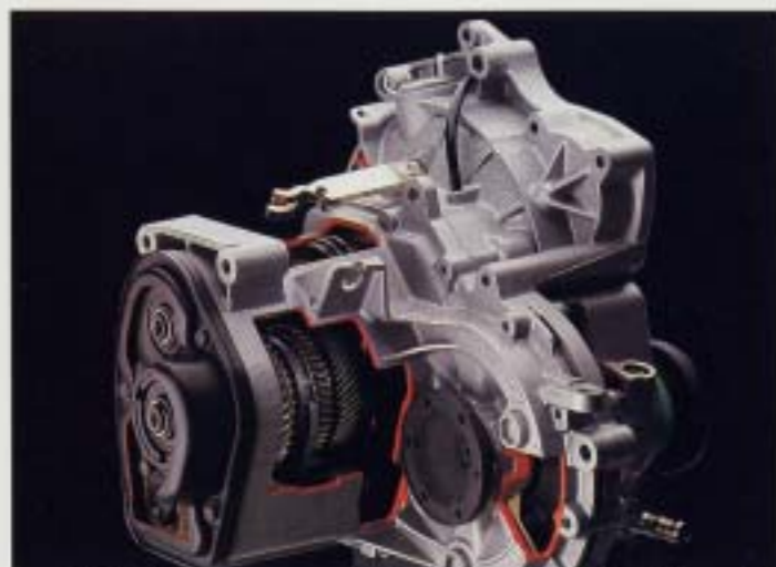
Femväxlad växellåda. Genom varvtalsminskningen i den femväxlade växellådan reduceras både ljudnivå och bränsleåtgång. Förutom att ett lägre varvtal innebär mindre förstärkning är drivaxlarna särskilt robusta lagrade med koniska rullager som bärrer till påfrestningar och ger längre livslängd.