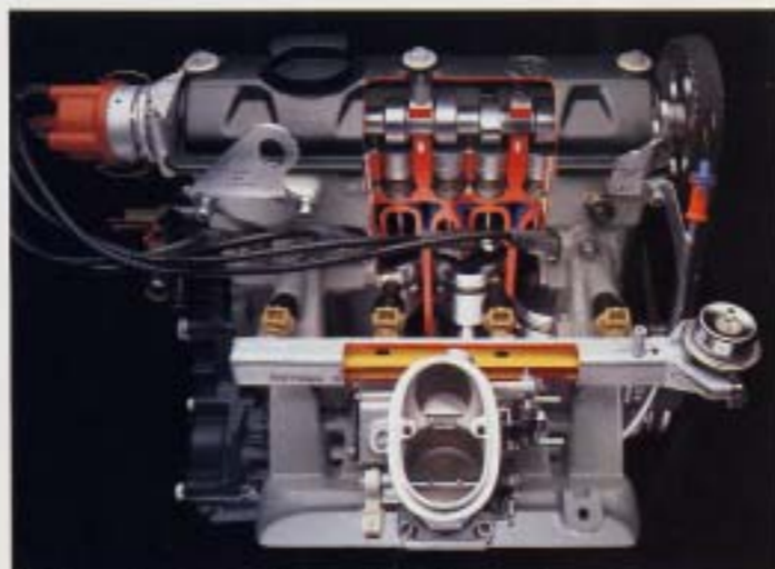
55 hk-motor. Nya Polo har en 1,3-liters effektiv 55 hk-motor. Motorn har insprutnings-systemet Motronic med lambda-reglering och katalysator.