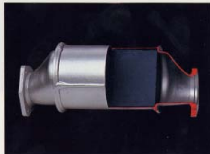
Katalysator. Polo är utrustad med katalysator. Katalysatorn startar och påskyndar en kemisk reaktion som omvandlar de giftiga beståndsdelarna till mindre farliga ämnen. Katalysatorn är särskilt effektiv tillsammans med lambda-inställningen och reducerar de giftiga beståndsdelarna i avgaserna till ett minimum.