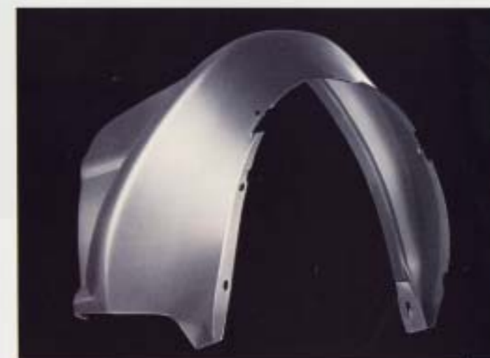
Delar av plast och underredsbekämpning. De delar som är mest utsatta för stenskott, som t.ex. de främre hjulhusen, är klädda i plast. Skarvar, fogar och fälsar tätas. Slutligen förses hela det område av bottenplattan som är mest utsatt för stenskott med ett tjockt, hållbart och elastiskt skikt av PVC-material.