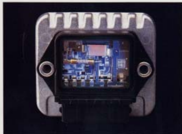
Brytaren i det elektroniska tändsystemet. Med transistortändningen får man en trygg start även under ogynnsamma väderleksförhållanden. Tändsystemet arbetar kontaktlöst och behöver därför, bortsett från att long-life tändstiftet byts var 3000:e mil inte någon skötsel. Den kraftiga tändningen gör för en säker förbränning och därmed ett bra utnyttjande av bränsle-luftblandningen.