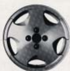
Bilden visar lättmetallfälg "Estoril". Fälgen erbjuds som merutrustning.