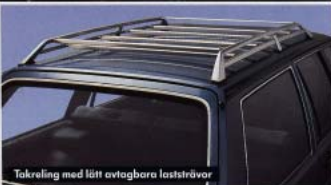
Takreling med lätt avtagbara laststrävor