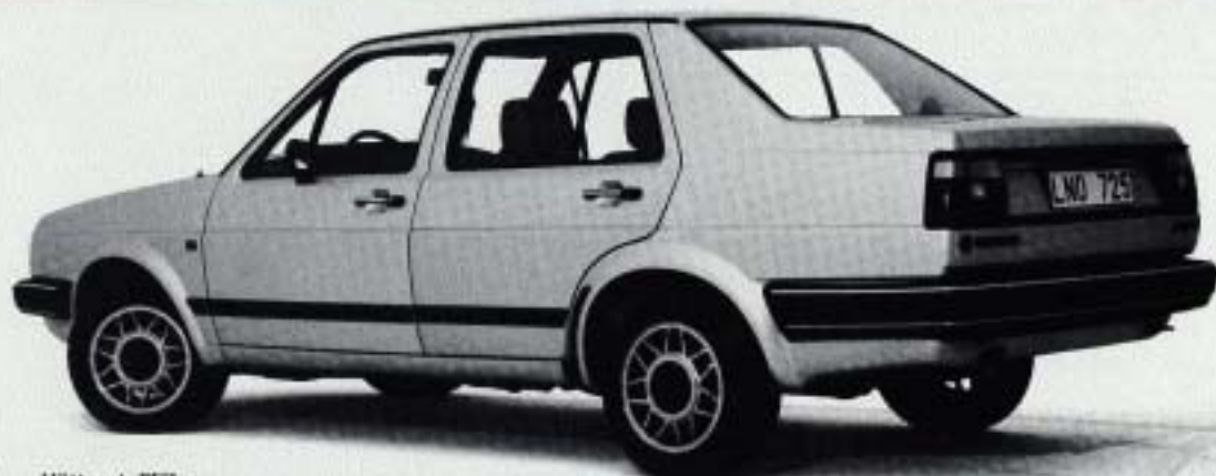
Extrautrustad med lättmetallfälgar