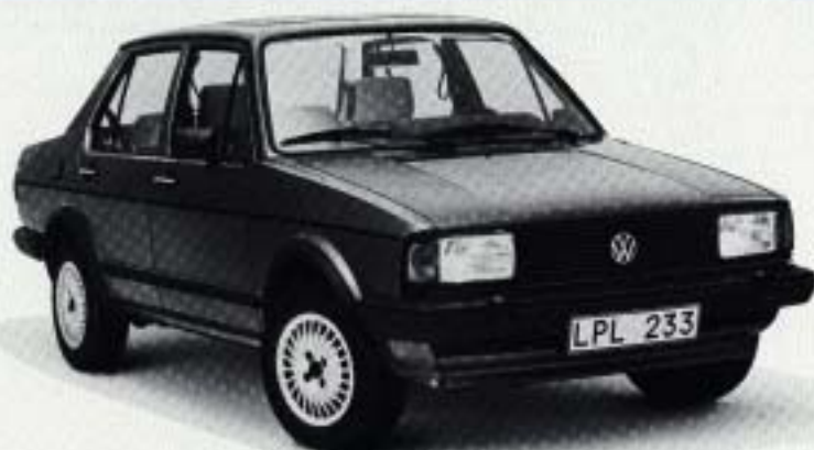
Bilden visar Jetta TX.