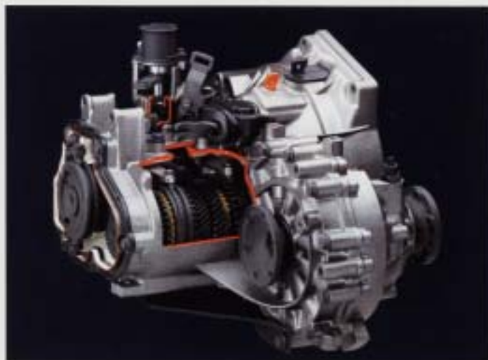
Femväxlad växellåda. Genom varvtalsminskningen i den femväxlade växellådan reduceras både ljudnivå och bränsleåtgång. Förutom att ett lägre varvtal innebär mindre förstärkning, är drivaxlarna särskilt robusta i lagrade med koriska rulager som bättre tål påfrestningar och ger längre livslängd.