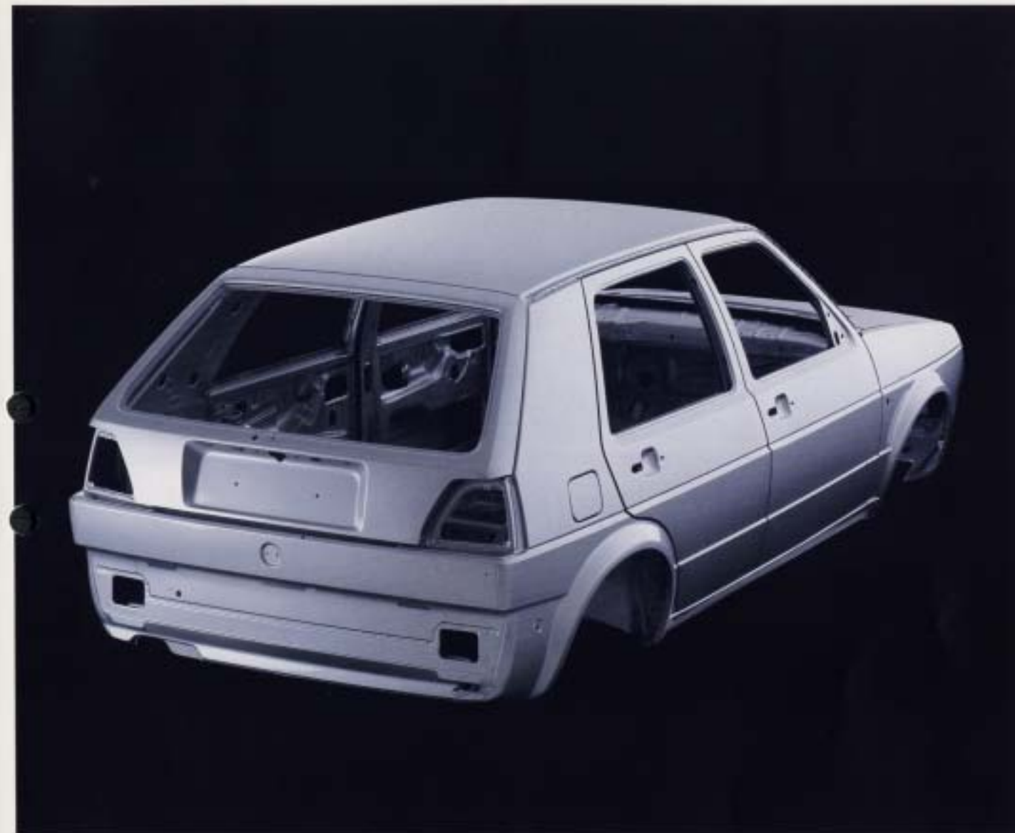
Korrosionsskyddad kaross. De delar av karossen som är särskilt utsatta för rost, som tex innerplåten på motorhuv, är tillverkad i förzinkad plåt. Alla de nedre hålligheterna i karossen, som dörrarna och bakluckans bakre del behandlas med hetvax som sprutas in i en effektiv automatisk process. På så sätt når vaxet även de mest avlägsna skymslän och vrår.