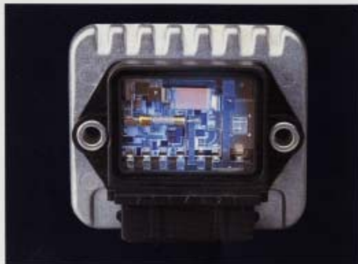
Brytaren i det elektroniska tändsystemet. Med transistortändningen får man en trygg start även under ogynnsamma väderleksförhållanden. Tändsystemet arbetar kontaktlöst och behöver därför, bortsett från att long-life tändstiftarna byts var 3000:e mil, inte någon skötsel. Den kraftiga tändgristen gör för en säker förbränning och därmed ett bra utnyttjande av bränsle-luftblandningen.