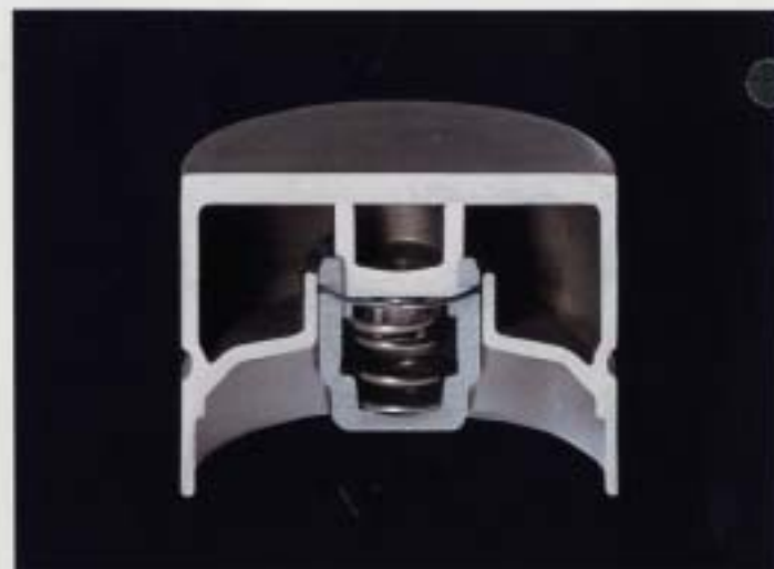
Hydrauliska ventilyftare. De hydrauliska koppventilyftarna kräver inte något underhåll och ger korrekt ventilspeglum.