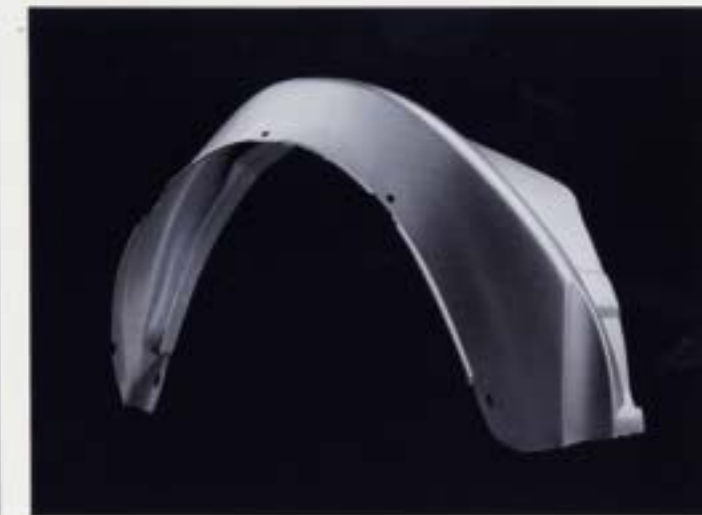
Delar av plast och underredsbeklädnad. De delar som är mest utsatta för stenskott, som tex de främre hjulhusen, är klädda i plast. Skarvar, fogar och fälgar täts. Skulfilen förses hela det område av bottenplattan som är mest utsatt för stenskott med ett tjockt, hållbart och elastiskt skikt av PVC-material.