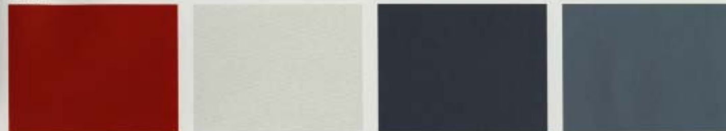
Tomadoröd Alpinvit Atlasgråmetallic Calypsometallic