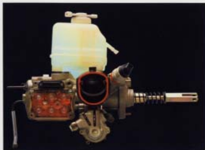
ABS-bromsar. Genom separata elektromagnetiska avkännare på alla fyra hjulen ser Voltas wagens avancerade lärningsfria ABS-bromssystem till att du alltid får maximal bromskraft på varje hjul oavsett underlag och samtidigt bibehåller styrbarmåga.