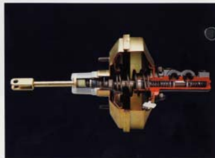
Bromskraftförstärkare. Med bromskraftförstärkaren bromsar man mjukt och säkert med obetydlig kraftförbrukning. Det undertryck som uppstår från motorn i insugningsröret, utnyttjas genom bromskraftförstärkaren till att stödja pedalkraften.