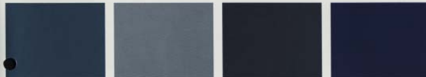
Mediumblåmetallic Diamantsilvermetallic Brilliantsvartmetallic Klarblåmetallic