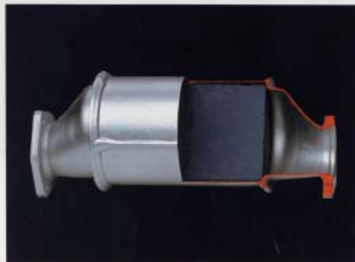
Katalysator. Samtliga Golf är utrustade med katalysator. Katalysatorn startar och påskyndar en kemisk reaktion som omvandlar de giftiga beståndsdelarna till mindre farliga ämnen. Katalysatorn är särskilt effektiv tillsammans med lambda-inställningen och reducerar de giftiga beståndsdelarna i avgaserna till ett minimum.