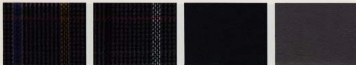
A B C Läder D Läder