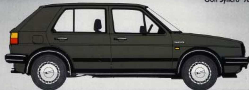
Golf Syncro 90 hk KAT