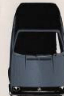
Golf Cabrio finns även i svart* lack och med ljusbeige sufflet

OBS! Denna broschyr är endast avsedd som en allmän information. Volkswagen tillverkar bilar för många länder med olika trafiklagar och föreskrifter om bilarnas utrustning. Därför kan det i denna broschyr finnas modeller och utrustningar som ej går att få i Sverige. Vissa specifikationer kan ha ändrats sedan tryckningen. Din Volkswagen-handlare har produktblad med alla aktuella uppgifter.