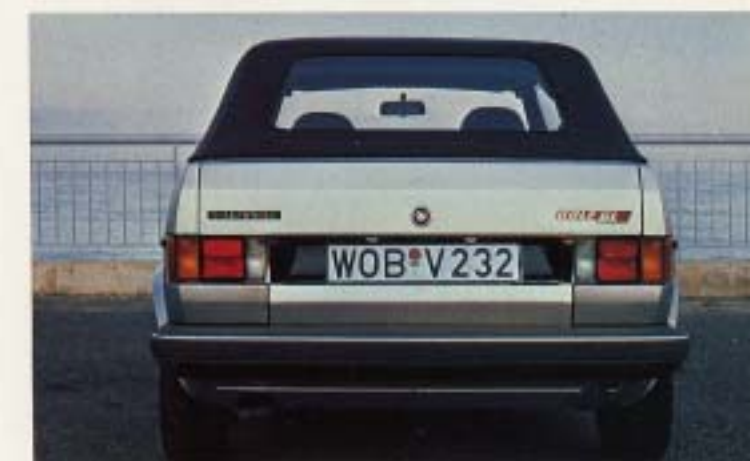
Bilderna visar Golf GL. Versionen som vi tar in i Sverige heter Golf GLI. Den har samma utrustningsstandard som Golf GTI i Limousine modellen. Det innebär bl a, skärmbreddare, sportratt, färdator, m.m.